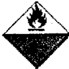
Materias Sujetas a Inflamación Espontánea.