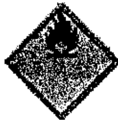
Emanación de Gas Inflamable Comburente al Contacto con el Agua